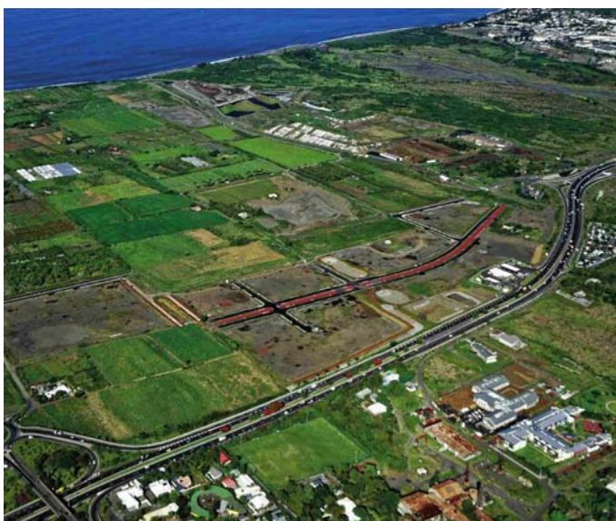
La zone d'activités de Pierrefonds, au cœur du projet de la CIVIS.

L'intercommunalité sudiste a élaboré une stratégie de développement urbain qui lui donne accès à un nouveau mode d'affectation des subventions FEDER : les investissements territoriaux intégrés.