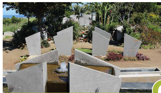
Columbariums/Cavernes Concession pour 10 ans