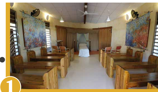
Salle d'adieu omniculture avec un accompagnement personnalisé